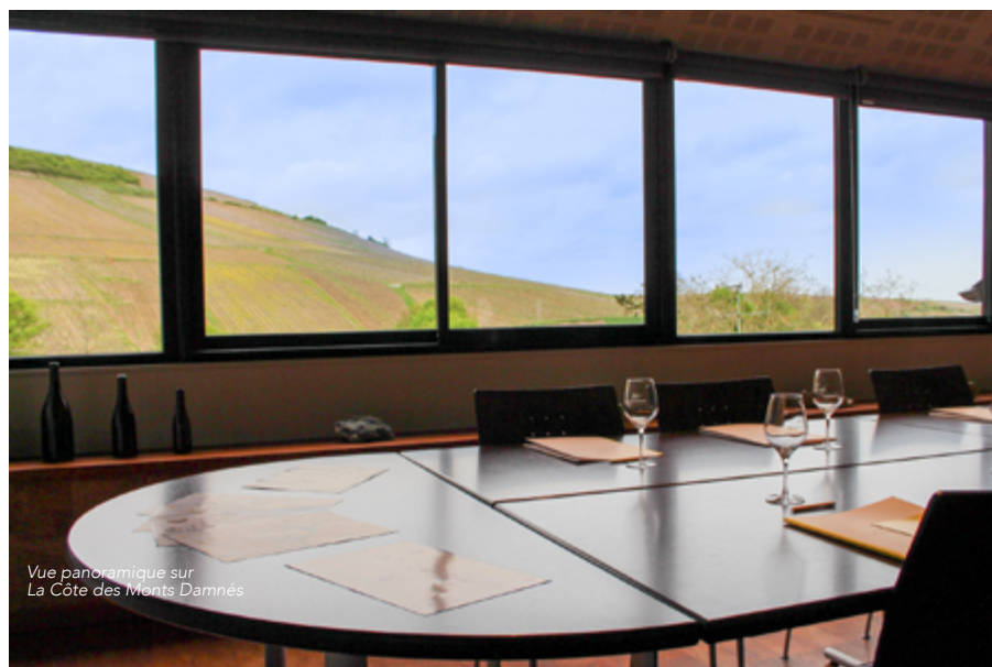
Vue panoramique sur La Côte des Monts Damnés